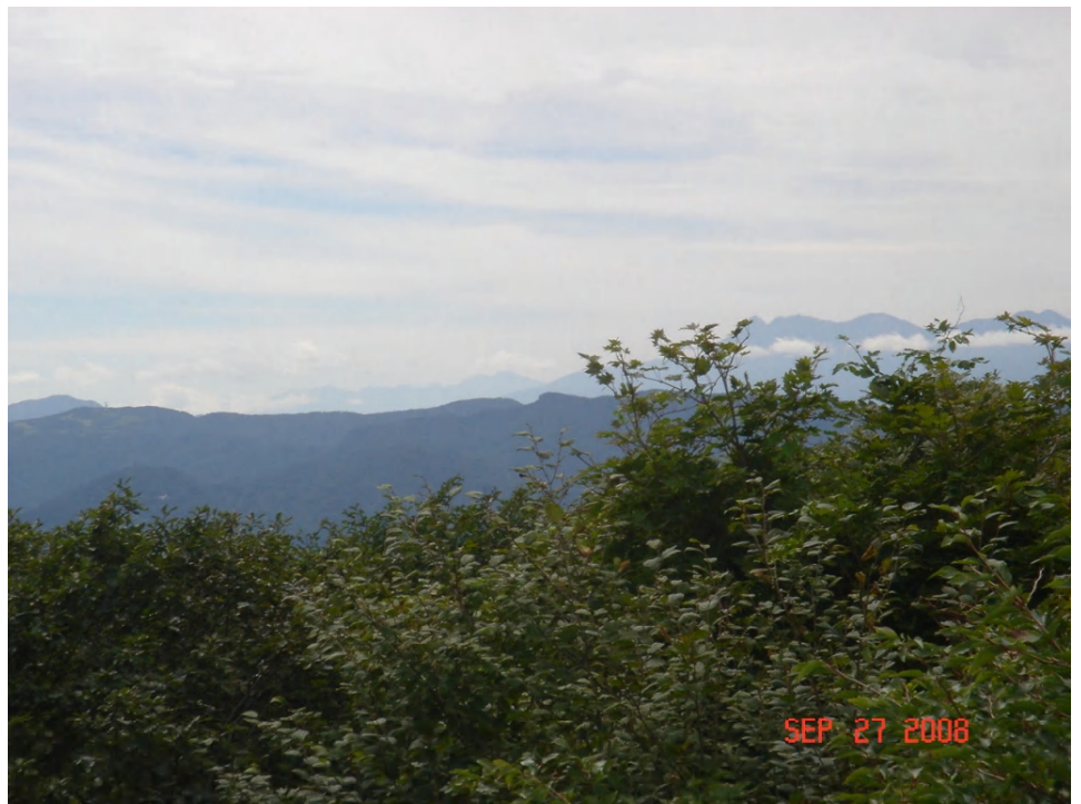
右手奥には、「八ヶ嶽連峰」が悠然と聳え立つ：110回・次回シニアOB山行は北八ヶ岳