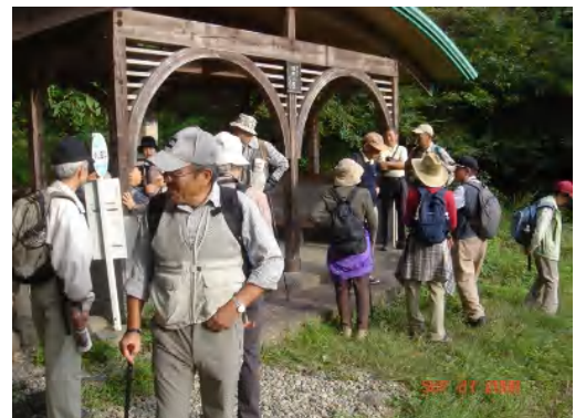
約8KM（標高差725M）もの長い下山を終えて