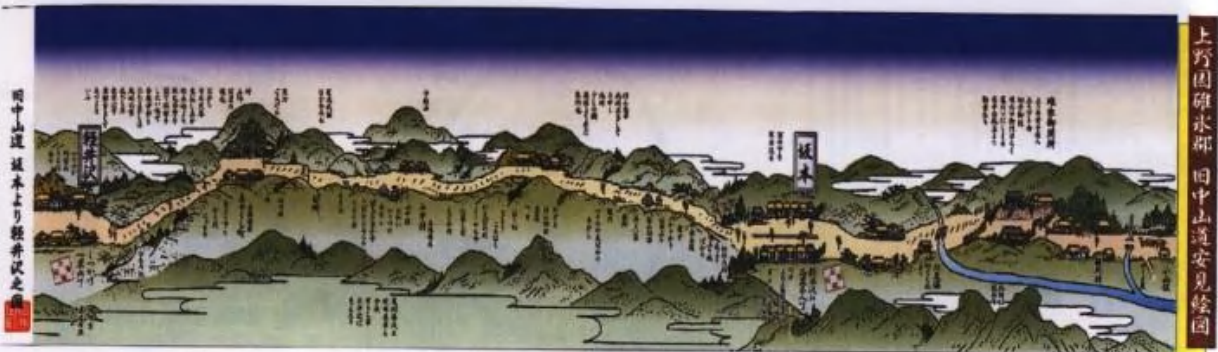
旧中山道 坂本より軽井沢之図 (松井田町)