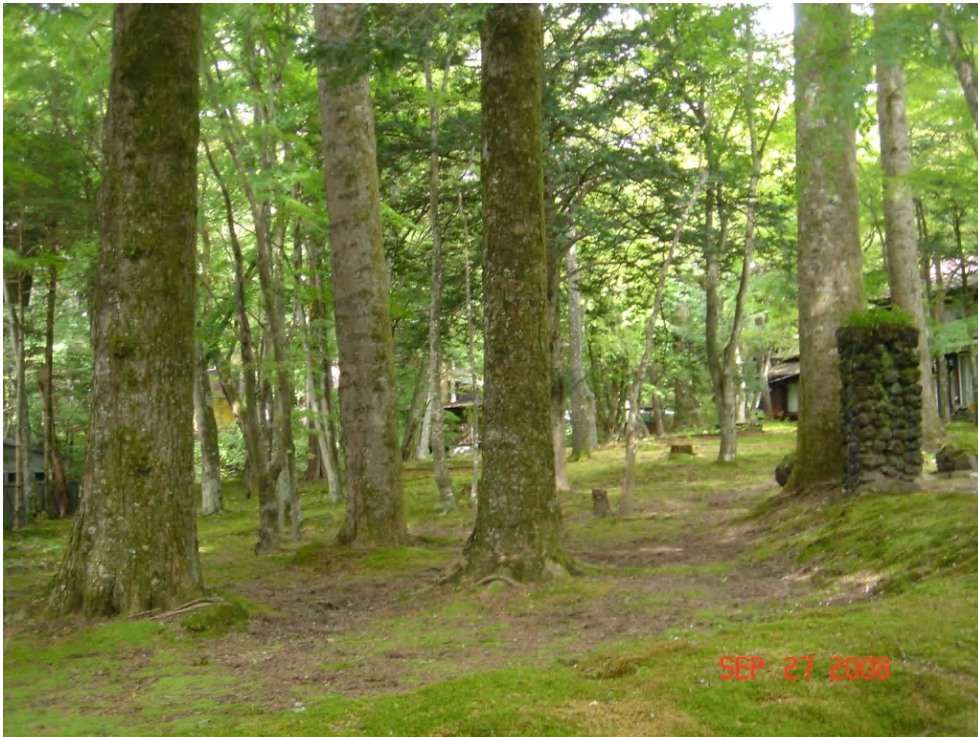
旧軽井沢銀座通りを抜けると静寂な、気品ある別荘地帯。そこをトボトボと眺めつつ