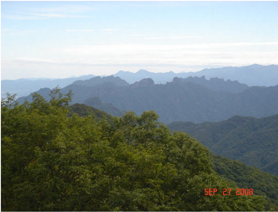
手前の連山は奇岩が山頂を覆う「妙義山」、奥は「秩父連峰」；旧碓氷峠見晴台にて昼食を摂る