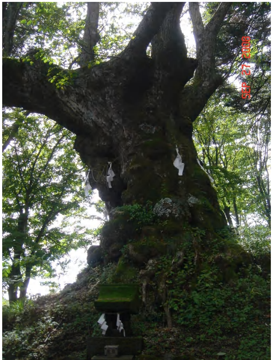
熊野神社のシナノキ（樹齢8百年と伝えられる）「シナ」結ぶ、縛る、括る の意のアイヌ語